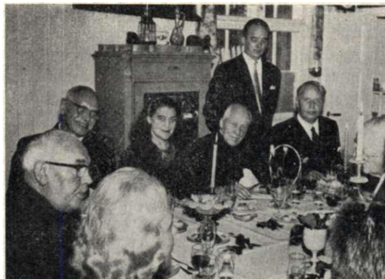
NORSKO. — Kard. Beran se synem norské spisovatelky Sigrid Undsetové a jeho chotí v Lillehameru.

Jinak stále se domníváme, že řád duchovna by měl především mít svůj přední úkol v záležitostech, jež se tak silně dotýkají lidstva, a to i před procesem technické masifikace, jež se odehrává před našima očima. V tomto směru a aspoň pro tento okamžik, chceme-li mluvit upřímně, perspektivy jsou sotva uspo-