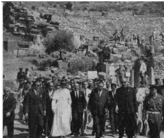
TURECKO. — Papež Pavel VI. uprostřed zřícenin v Efezu.

Podle Státního úřadu statistického byla loni bilance obyvatelstva až na r. 1962 nejhorší v poválečných letech. Počet živě narozených dětí klesl o víc než devět tisíc a zvýšil se počet potratů: v Českých zemích o 9,2%, na Slovensku o 10,4%. Počet registrovaných potratů vzrostl na 115 463, protože se snížila úmrtnost, přirozený přírůstek v r. 1966 představuje jen 80 583 obyvatel. Vzrostl též počet rozvodů: v Českých ze-