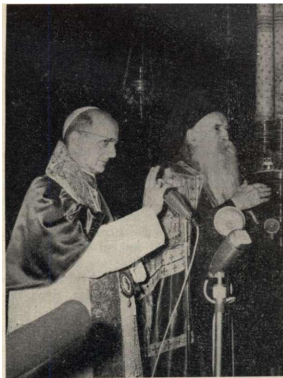
TURECKO. — Pavel VI. a patriarcha Atenagoras udělují spolu požehnání po skončení pobožnosti v patriarchálním kostele sv. Jiří na Fanaru.

Odpolední hodiny byly věnovány prohlídce města. Průvodce dělali papeži sám prezident, ministr zahraničí a istanbulský starosta. Mezi křesťanskými chrámy proměněnými na mešity a štíhlými minarety papeže zajímala samozřejmě mohutná stavba chrámu Svaté sofie — Boží moudrosti. Původní kostel, postavený za Kon-