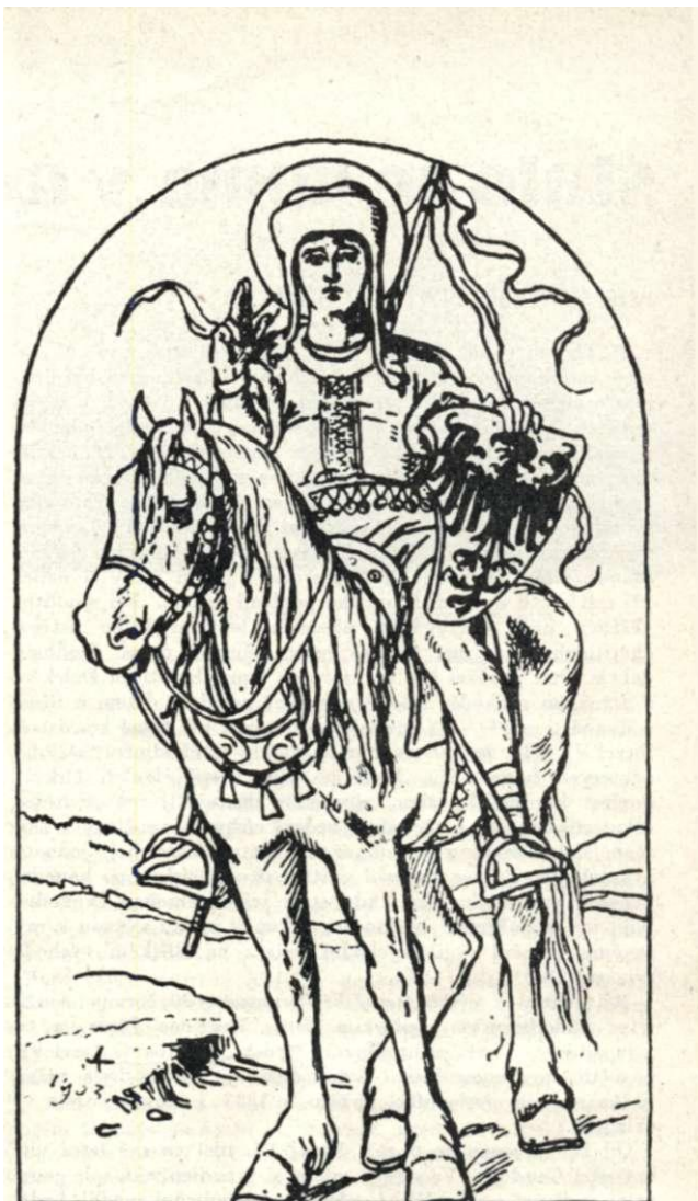
MIKULÁŠ ALEŠ: Svatý Václav

Biskup Heřman se podíval na podávaný kousek a řekl : Co je to ? Část ze závoje svatě Ludmily, patronky naší nejpřednější. — I stalo se, čeho se aba-