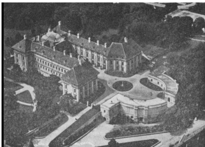
SLAVKOV. — Pohled z letadla na zámek

změně světa; křesťanský pojem stvoření není jednou vykonaný Boží kon, ale je to stále trvající proces lidstva, které v dějinách vytváří samo sebe.