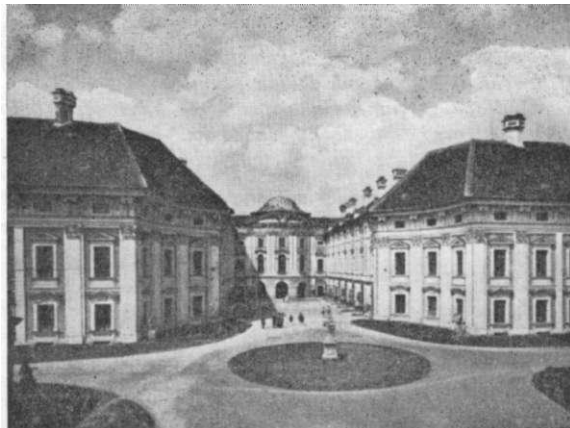
SLAVKOV. — Nádvoří zámku