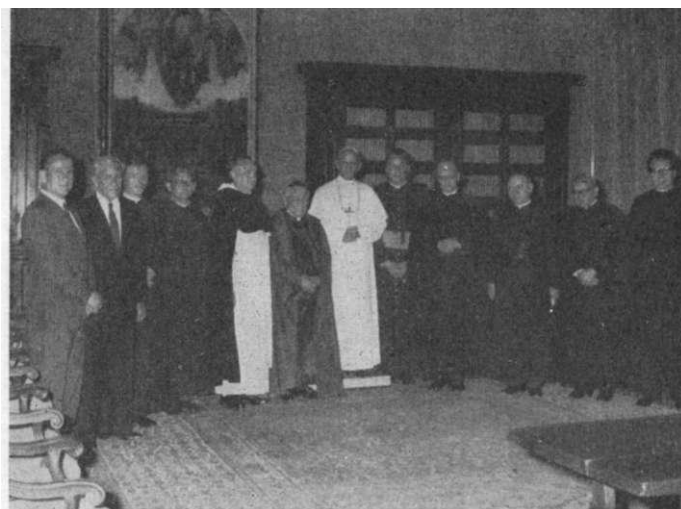
Sv. Otec a kard. Beran v kruhu českých římských kněží z Českého náboženského střediska a Křesťanské akademie.