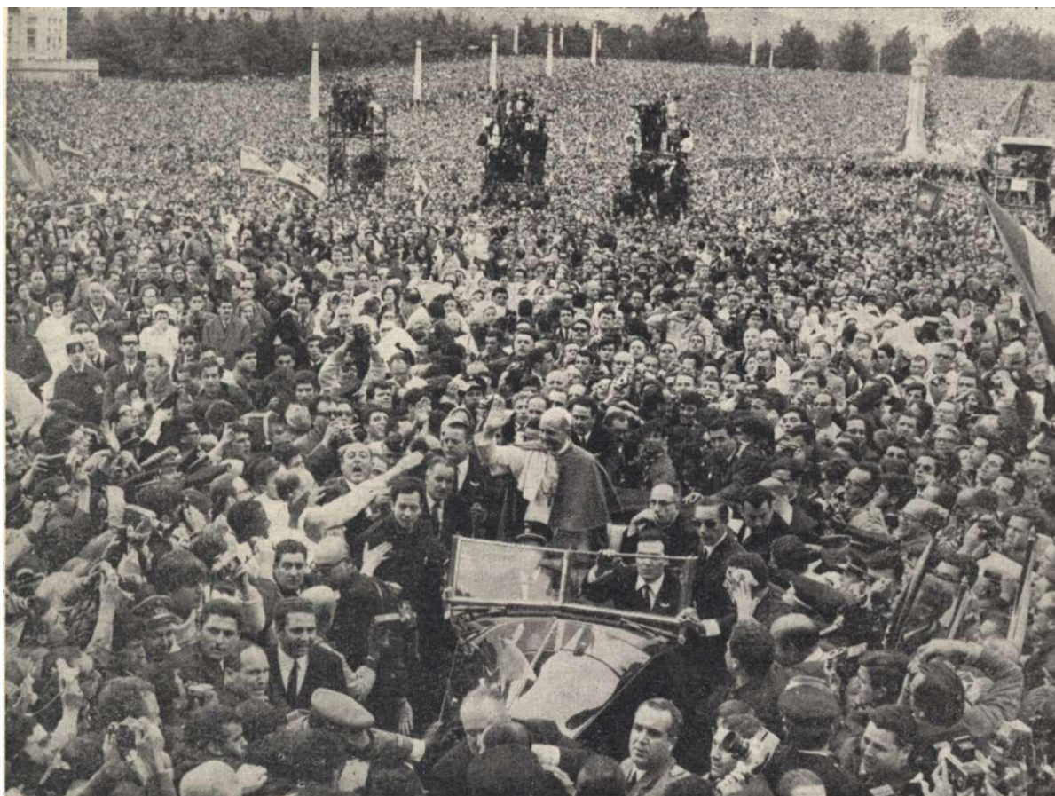
FATIMA. — Papež Pavel VI. jede k tribuně v čele prostranství

fatimskou svatyni; katolická mládež z Brazílie poslala růže, z Holandska došly tulipány, z Madeiry orchideje, nejrůznější tropické květiny z Východu a z Ameriky. Portugalská televize, teprve v začátcích, s pomocí francouzské a italské hleděla zajistit přímé vysílání do evropských zemí; v Americe budou moci sledovat přenos prostřednictvím telekomunikační družice Telstar; společnost CBS bude mít televizní vysílání barevné.