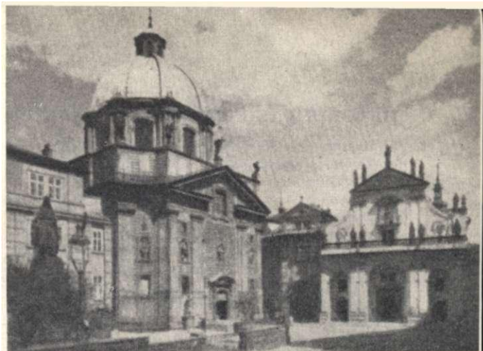
Křížovnické náměstí na Starém Městě pražském. Zleva vidíme sochu Karla IV. od Haehnela, postavenou k 500. výročí založení university, křížovnický kostel sv. Františka a universitní kostel sv. Salvátora.

dnešní vychovatelé se i ptají, co bude inženýr dělat s volným časem, a snaží se ho přivést k tomu, aby sledoval myšlenkový vývoj společnosti jako celku a využil aspoň zčásti hodin, jež mu zbývají po práci. Je potěšující, že tento směr vychází nikoli od humanistů, ať jsou to historikové, filologové nebo filosofové, ale od představitelů praktických oborů, jakými jsou vedoucí inženýrských komor a profesori technologie.