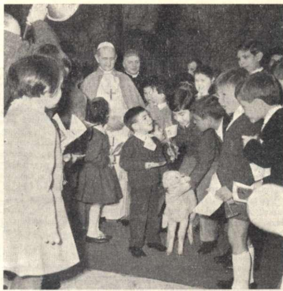
SV. OTEC PAVEL VI. uprostřed dětí, vítězů soutěže o nejkrásnější betlém postavený v římských rodinách.